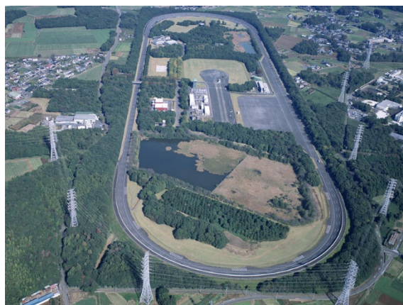
図1 産総研テストコース全景(1981年11月完成)

テストコース(図1)の東西全3車線を改修し、それぞれ最外周の第3車線には合計6つの特殊路(車両評価のための特殊な路面)を設置した(図2)。これにより、直線部の走行がよりスムーズになるとともに、実際の路面を模擬した特殊路を活用して、乗り心地などに関して実際の走行状況に即した車両評価が行えるようになった。