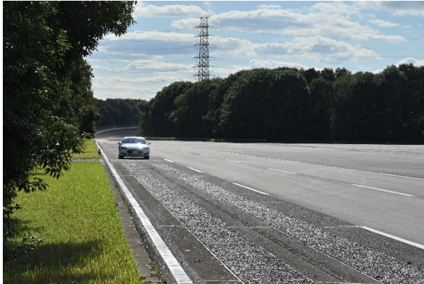
(左)使用を開始したテストコース

本件配布先:【産総研】経済産業記者会、経済産業省ペンクラブ、中小企業庁ペンクラブ、資源記者クラブ、 文部科学記者会、科学記者会、筑波研究学園都市記者会、【住友理工】中部経済産業記者会