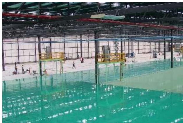
建設が進むオドネル工場の新建屋

当社グループは、2022 年度を最終年度とする中期経営ビジョン「2022 年 住友理工グループ Vision」で、「着実な成長と体質強化」を取り組むべきテーマに掲げ、これまで事業構造改革や拠点再編を進めてきました。今回の増強策は、これを背景とした戦略的投資の一環です。SRK-QRO を北米における自動車用防振ゴム生産のハブ拠点の一つと位置付け、高品質な製品を迅速かつ安定的にお客様へお届けできるよう、供給体制の整備と拡充をさらに進めてまいります。